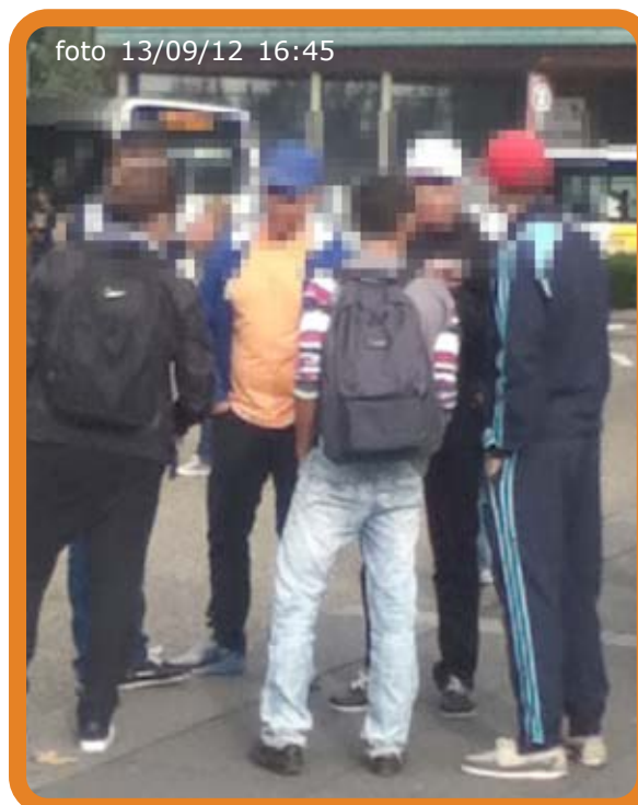
Genk station : minstens twee van deze jongeren zouden meer weten over de vechtpartij die daar daags voordien heeft plaatsgevonden. Het zijn altijd dezelfde personen die aan het station rondhangen zeggen meerdere bronnen. Dat de problemen blijven aanslepen wordt aan de politie toegeschreven.

redactie bij Infrabel daarover vragen gesteld, de problemen werden bevestigd en men verwees toen naar camera's die werden geplaatst waardoor men hoopte dat de situatie zou verbeteren, maar dat blijkt dus niet te kloppen, integendeel. Het is alleen de Genkse burgemeester die zichzelf blijft wijsmaken dat er geen problemen zijn.