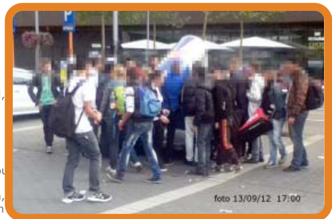
Genk station : Het samentroepen rond deze reclame van een drankmerk was daags na de vechtpartij, de politie was wel in de buurt maar ondernam niets.

redactie bij Infrabel daarover vragen gesteld, de problemen werden bevestigd en men verwees toen naar camera's die werden geplaatst waardoor men hoopte dat de situatie zou verbeteren, maar dat blijkt dus niet te kloppen, integendeel. Het is alleen de Genkse burgemeester die zichzelf blijft wijsmaken dat er geen problemen zijn.