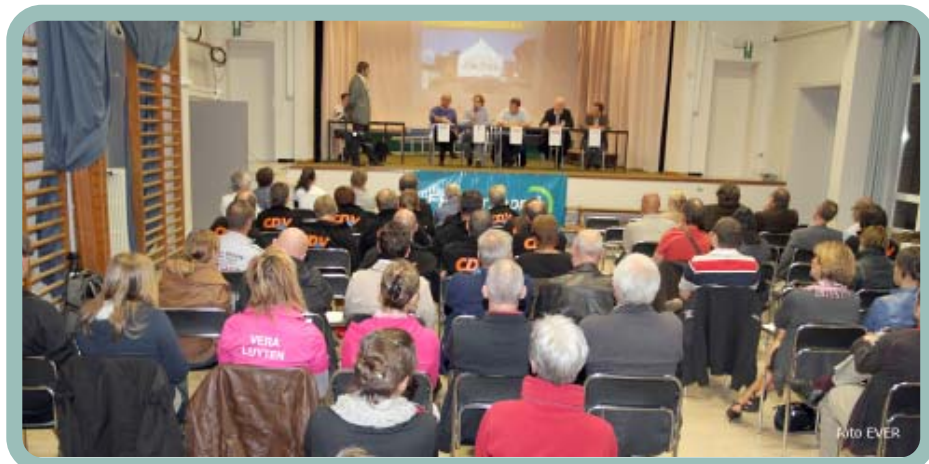
Misschien komen ze wel op de Vrt zoniet was er geen belangstelling geweest