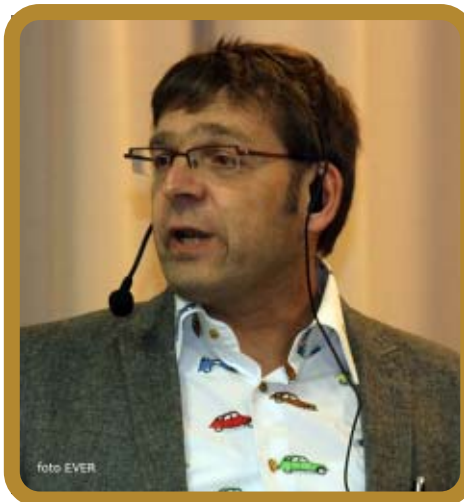
Moederator Kris Peeters heeft een groot probleem : hij is amper twee keer in Begijnendijk geweest

10. Concretiseer voorgaande punten in een fietsactieplan en maak een voor de uitvoering van dat plan een deskundige mobiliteitsambtenaar verantwoordelijk.