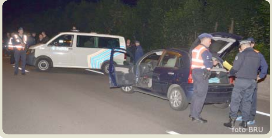
controle aan de 2e grenspost

Tijdens Goliath werden 182 voertuigen en 236 personen gecontroleerd waarbij in totaal 5 mannen werden opgepakt die ervan verdacht worden