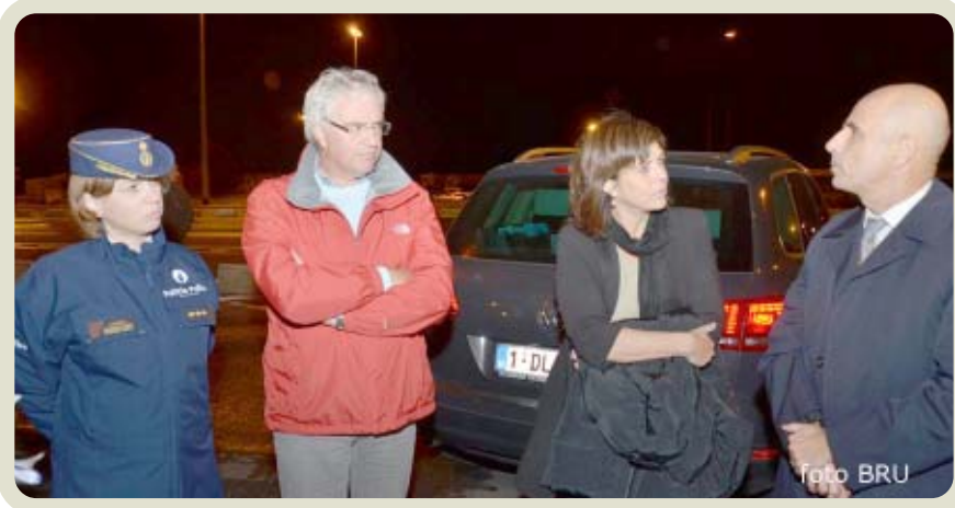
de commissaris- generaal - Gouverneur De Caluwe - minister Milquet - Franse Préfet

nummerplaten gecontroleerd waarin heel wat groot-tuinmateriaal werd aangetroffen, o.a. zitmaaiers. De bestuurder werd aangehouden en het