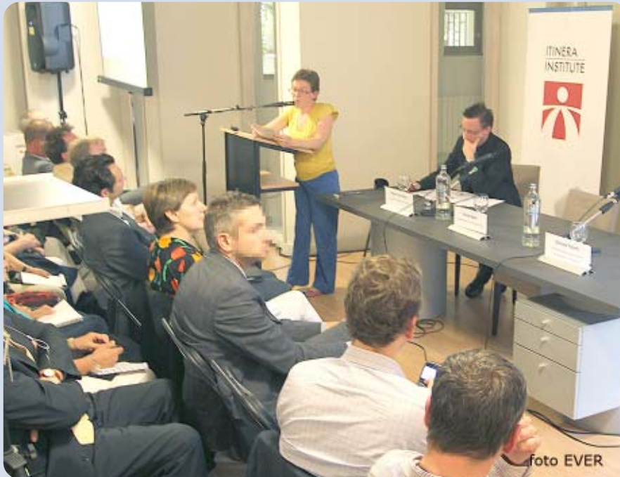
31 augustus 2012 sessie rond ouderenzorgbeleid .. maar is er wel een beleid?

Zoals eenieder weet, is de vergrijzing één van de grote uitdagingen van de komende decennia. Op 31 augustus 2012 organiseerde de onafhankelijke denktank Itinera Institute, een evenement rond dit onderwerp met mogelijke oplossingen om het nakende, steeds dichterbij komende probleem, zo goed mogelijk het hoofd te bieden. Wereldwijd zal het aantal 65 plussers verdubbelen, het aantal 85 plussers zal met een factor 3,5 toenemen, tegen 2025 zelfs verdubbelen, en het aantal 100 plussers zal vertienvoudigen. Actie is dus nodig en wel snel, zo niet doet er zich een bedreiging voor, voor de publieke middelen.