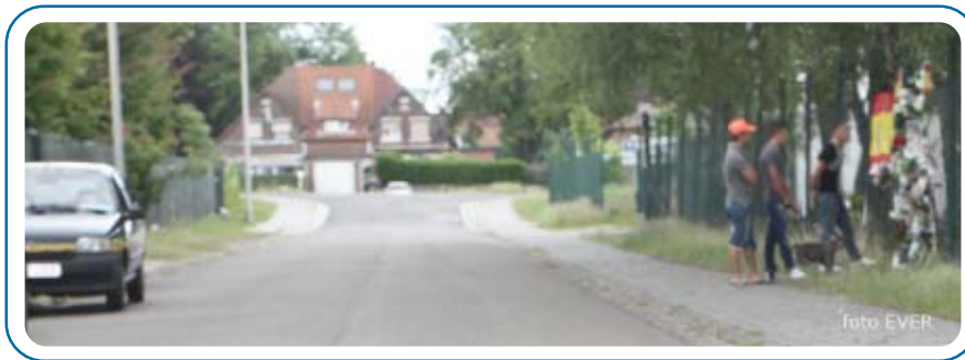
De plaats van het ongeval op 1 juli 2012 rond half vijf.

Daags na het dodelijke ongeval dat zich op 30 juni 2012 in de Minderbroederstraat had voorgedaan, werd er door bepaalde personen met Morsum Magnificat contact genomen. Om half vijf hadden we op de plaats van het ongeval afgesproken, daar hadden we een gesprek met ondermeer de bestuurder van de brommer die zonder helm over de Hoevenzavellaan aan de achtervolging van de Genkse politie was ontsnapt, wij menen deze persoon wel te herkennen uit twee andere dossiers uit Genk, ondermeer uit een steekpartij aan een jeugdhuis. Ook Rafael Fernandez die zich in de Minderbroederstraat om een nog onduidelijke reden te pletter reed, kon aan de politie ontsnappen. Sommige van de personen hadden het over een getuige die in de Minderbroederstraat zou wonen.