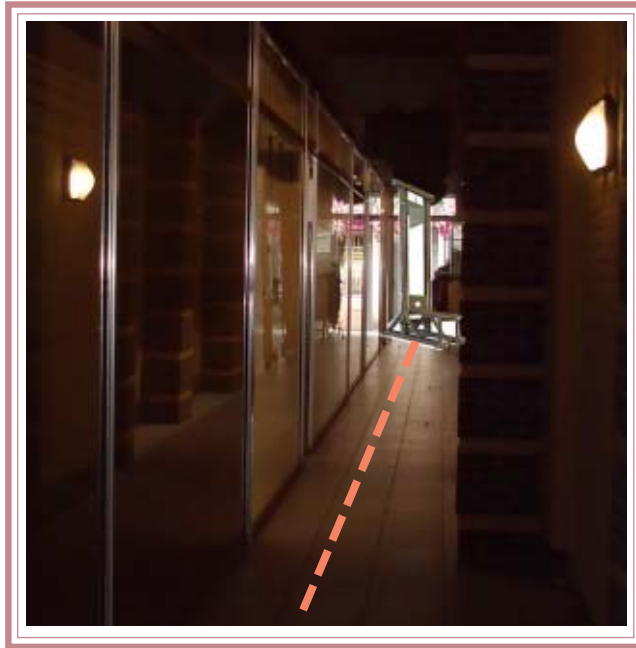
Aan het einde van de gang wacht de guillotine