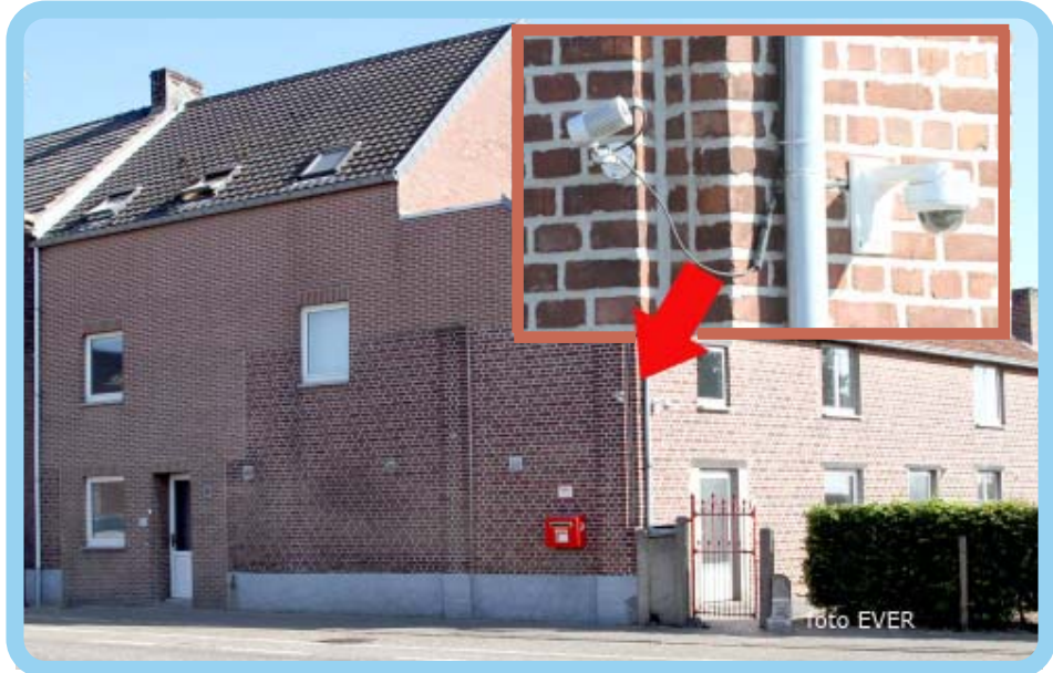
Melroos Plaiz twee camera's zonder pictogrammen

Lanaken, maar die reageerde niet, toch zijn ze dat overeenkomstig het Decreet Openheid van Bestuur, verplicht te doen.