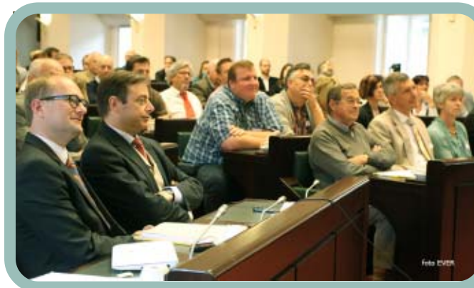
Ben Weyts en Bart De Wever in een volle zaal