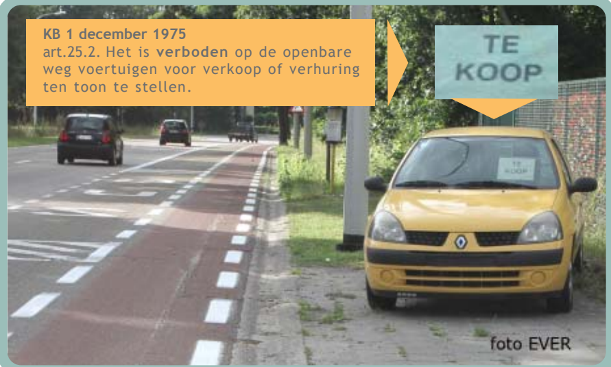
Wiemesmeerstraat 55 auto te koop en dat is schering en inslag langs deze weg

gevallen diens verantwoordelijkheid op, ook de Genkse oppositie trekt zich daar niets van aan, toch is dat ook hun taak.