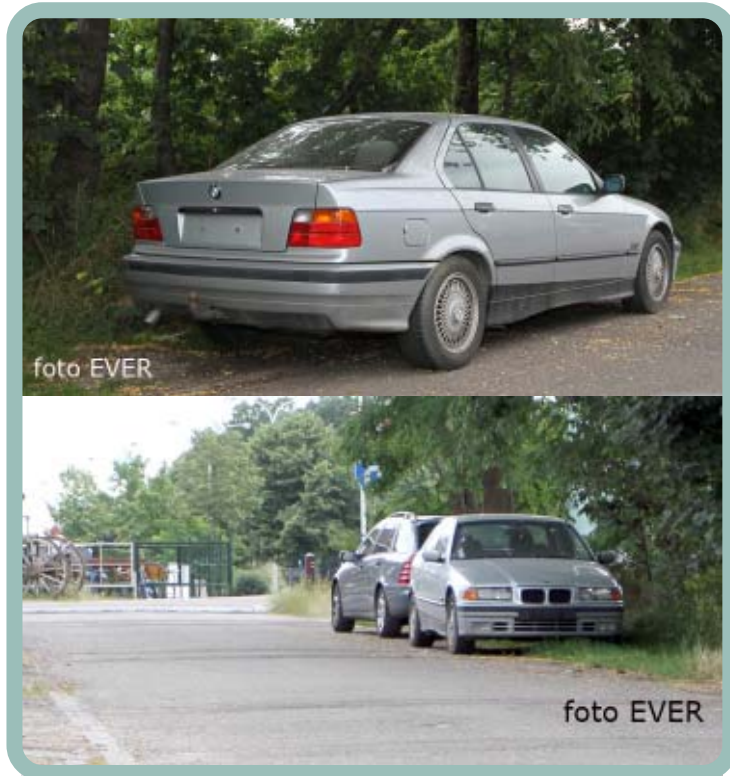
Hoevenzavellaan 108 BMW en geen nummerplaten

Als Genk het fout parkeren van auto's op haar beloop laat en auto's die zonder nummerplaat op de openbare staan noch door de politie, noch door de milieudienst worden aangepakt, dan neemt de Genkse burgemeester in geen van beide