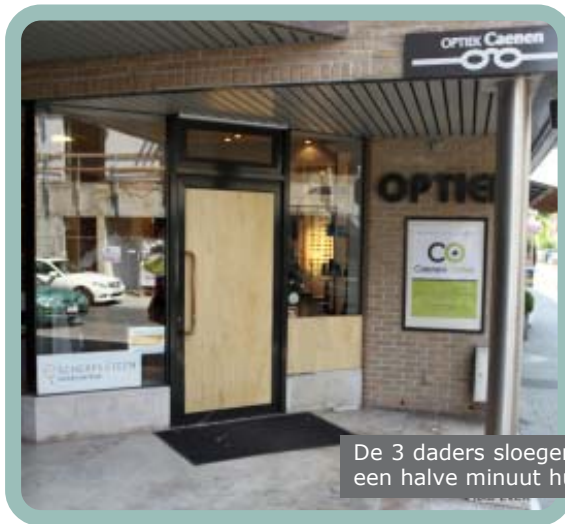
De 3 daders sloegen binnen een halve minuut hun slag

Kort na de middag was de deur al met een houten paneel opnieuw dichtgemaakt.