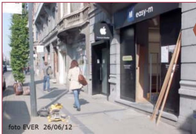
Easy-m werd door MM op de hoogte gebracht