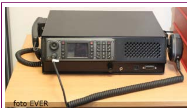
Mobiel toestel d A.S.T.R.I.D.nv ingebouwd met accessoires uit de oude doos. We twijfelen eraan of het toestel wel op een antenne was aangesloten, maar dat kan later of zelfs met indoor antenne.