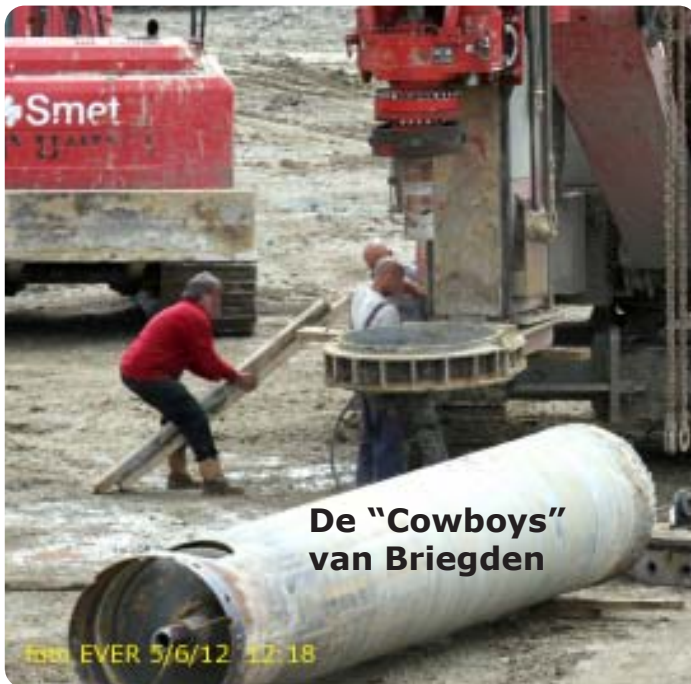
De "Cowboys" van Briegden

Geen helmen , sommigen zelfs geen handschoenen