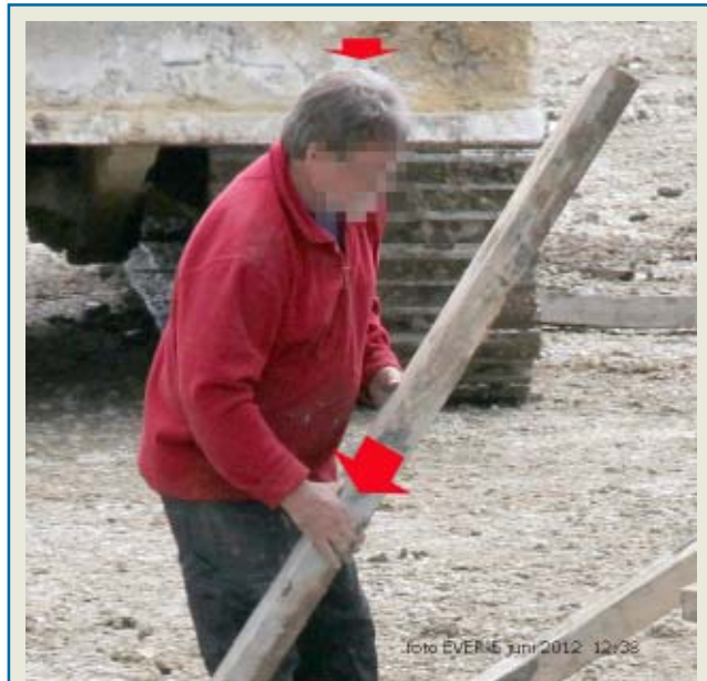
Deze persoon op de werf van de nv De Scheepvaart / Roegiers heeft geen helm en geen handschoenen nodig, hij manipuleert houten balken en wandelt tussen allerlei machines van Smet Dessel.

Vlaams Belang fan is, moeten we de zienswijze