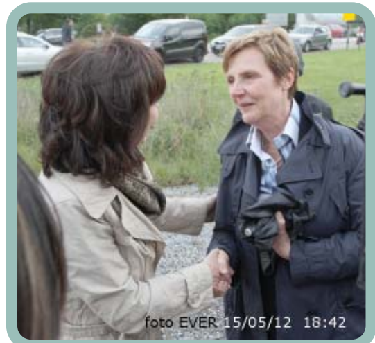
Mevrouw de Procureur hield het om 18:42u. voor bekeken.