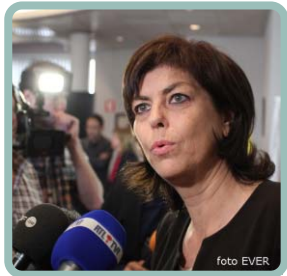
D'abord, avant tout et tous : RTL

14.1.2.2. Bestendige participatie grootschalige actie -SLIM controles-.