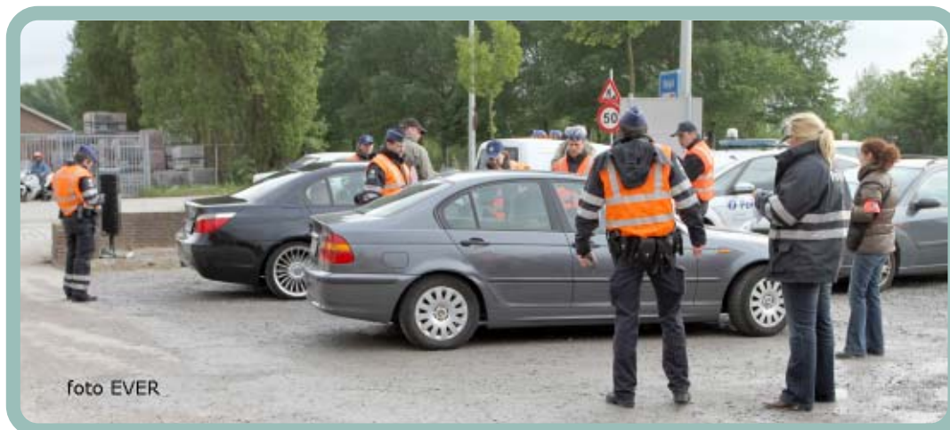
Er wordt inderdaad geselecteerd, grote auto's, laag profielbanden en jeugdige bestuurders worden van de weg geplukt en gecontroleerd.

8.7. Vermaakuitstappen, discotheken, buiten de gemeente.