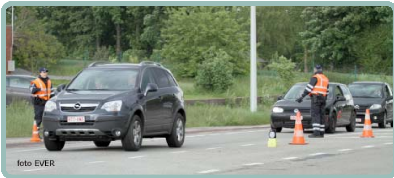
15 mei 12 Veltwezelt aan de grensovergang met Nederland