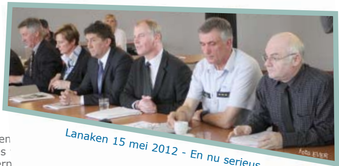
Lanaken 15 mei 2012 - En nu serieus..