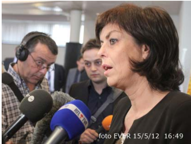
Minister Milquet na één uur logische vertraging éérs voor de Franstalige pers, TV Limburg stond er bij en keek er -beteuterd- naar. Ook hier, net als in Kortrijk, begroette de burgemeester minister Milquet in het Frans!

verkoop van drugs voorkomen en dit na de heisa rond de coffeeshops in Maastricht. De minister benadrukte het opdrijven van de grenscontroles en de goede samenwerking tussen de Nederlandse en de Belgische politiediensten, alsmede de eventuele steun van de interventie eenheden van de federale politie en dit voor een langere periode. Dat is ook het geval voor de zones, ook zij leveren een inspanning tot meer samenwerking met de Nederlandse politie. "We zijn hier niet aanwezig om te verdwijnen zonder iets te zeggen" zei de minister. Vlak vóór 1 mei is er met de autoriteiten gekeken wat de dispositieven zijn, of er versterking nodig is, die analyse gaan we vandaag bekijken zei de minister aan de Franstalige pers. Dat interview duurde vier minuten en pas daarna mocht TVL, óók onder druk van wachtende gesprekspartners, enkele vragen stellen waarna de vergadering met één uur vertraging kon beginnen.