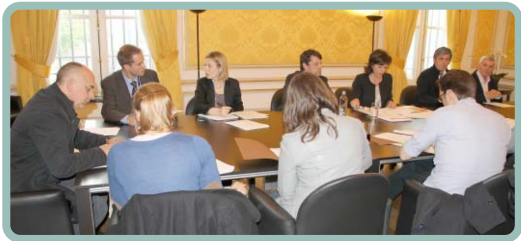
De persconferentie op het ministerie van Binnenlandse Zaken over de Civiele Veiligheid

zelfstandige organisatie van de brandweergebieden wordt opgestart. Deze week wordt reeds een belangrijk wetsontwerp in het parlement neergelegd betreffende de toekenning van een rechtspersoonlijkheid aan de pregebieden en een bestendige federale dotatie. Dit voorontwerp voorziet ondermeer: ◦ De geleidelijke inwerkingstelling van de minimale normen voor de uitrusting van individuele en collectieve bescherming van de brandweersluis.