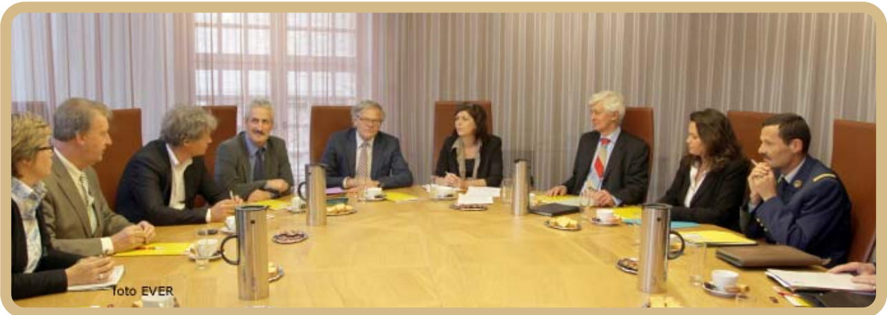
Overleg in sneltempo in de nieuwe te kleine schepenzaal van het Kortrijkse stadhuis