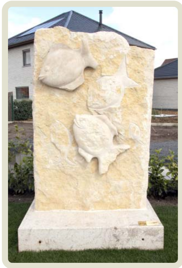
Het kunstwerk "Stroom opwaarts"