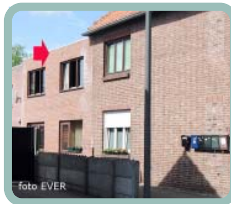
Achter de voorbouw werden nog vier studio's opgetrokken die geen afzonderlijke elektriciteits- of watermeter hebben ....

Het moet blijken dat er vragen zijn over het aantal