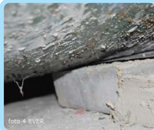
Foto 4 Betonnen steunbalk 1 onderkant.