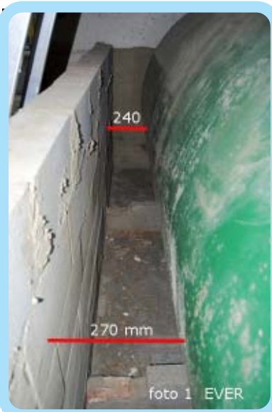
Foto 1 afstand tot omkuiping links