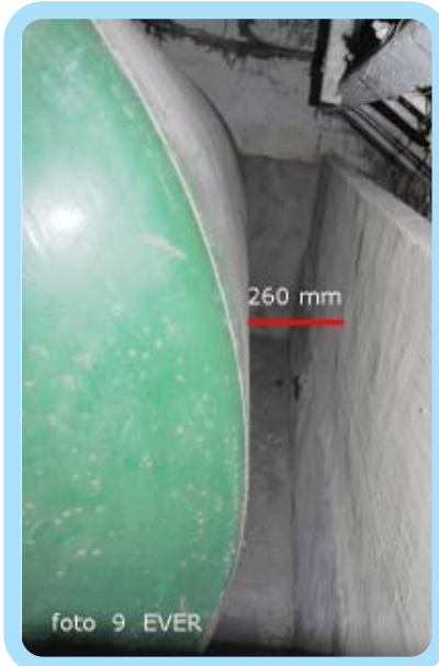
Foto 9 afstand tot omkuiping rechts.