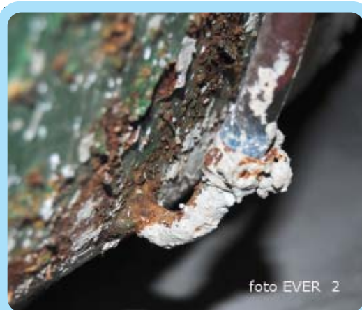
Foto 2 onderste slangklem niveaumeting