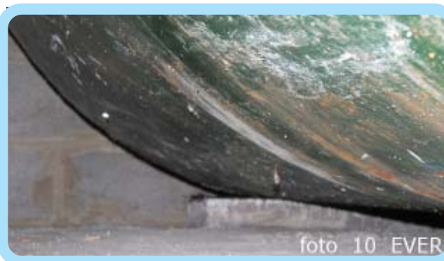
Foto 10 steun onder de tank