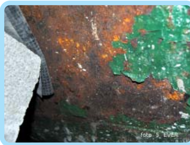
Foto 5 steun 2 en staat van de tank.