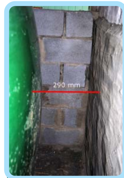
Foto 8 afstand tot muur.

In de marge. De tank is in het horizontale vlak onstabiel - er is geen blokkering -zie foto 10-