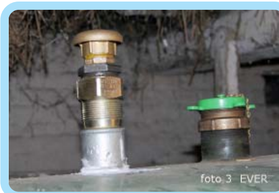
Foto 3 Groene dop SV 03245 29.03.2012