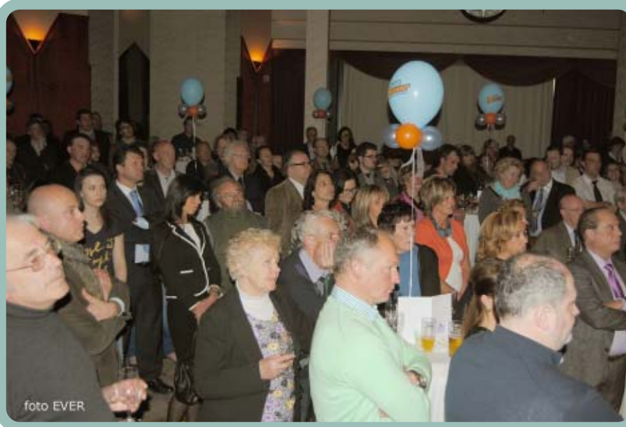
Een deel van de vele toeschouwers tijdens de toespraak van Jean-Marie

LDD komt niet op voor de provinciale verkiezingen aangezien dat in hun ogen nutteloze tussenschotten zijn in het politiek bestel, provincies mogen voor LDD worden afgeschaft. Provinciegouverneur is een uitloopbaantje voor afgedankte politici en provincies zijn enkel