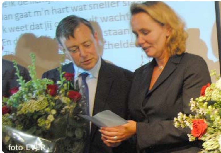
Bart De Wever en Liesbeth Homans lezen de teksten van het 'Antwerps volkslied'; Lichtjes van de Schelde

het even moeilijk heeft. Maximale begeleiding naar werk is dus het uitgangspunt. Een warme samenleving kan slechts gecreëerd worden indien