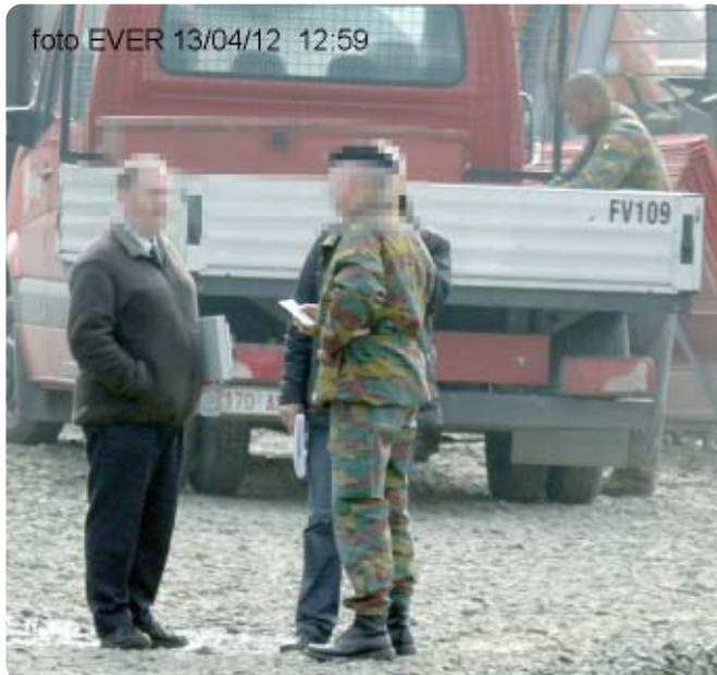
Militairen op 13 april 2012 om 12:59u., één ervan is bezig met het afladen van een bestelauto van de firma Smet Jet ... Defensie heeft dus tegen Morsum Magnificat gelogen. Waarom?

een risicoanalyse dient opgesteld staat in het KB van 25 januari 2011, ook de firma Wolf bvba heeft ze opgesteld. Quasi onmiddellijk toen de firma Roegiers dacht dat de firma Wolf aan Morsum Magnificat informatie had gegeven werd de heer D. van de firma Wolf door Roegiers benaderd. Pure intimidatie is dat. Hoe dan ook, de firma Wolf kroop in haar schelp, we kregen de heer D. zelfs niet meer aan de lijn. Nog maar eens een staaltje in welk democratisch land we hier leven.