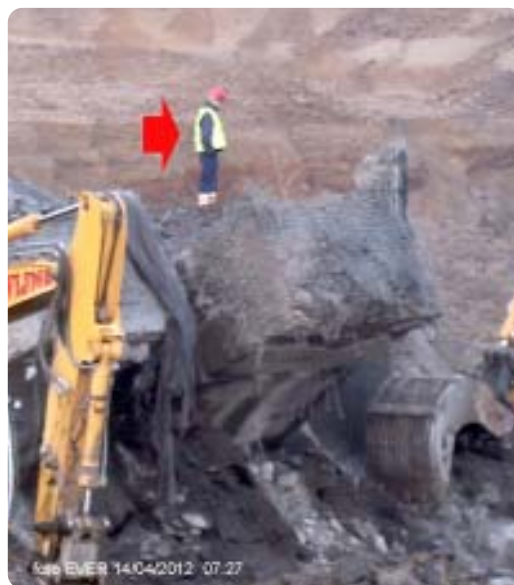
Observeren of de toerist uithangen?

gerespecteerd, vooral bij sloopwerken en werken op hoogten, zijn de risico's voor ernstige ongevallen groot. Daar waar, wanneer er in principe geen werken boven het hoofd worden uitgevoerd, de persoon in kwestie geen helm dient te dragen, is dat wel het geval wanneer bij het betreden van de werf borden deze verplichting opleggen. We hebben diverse personen en fotografen, ook van de gemeente, gezien die geen helm droegen. Dat