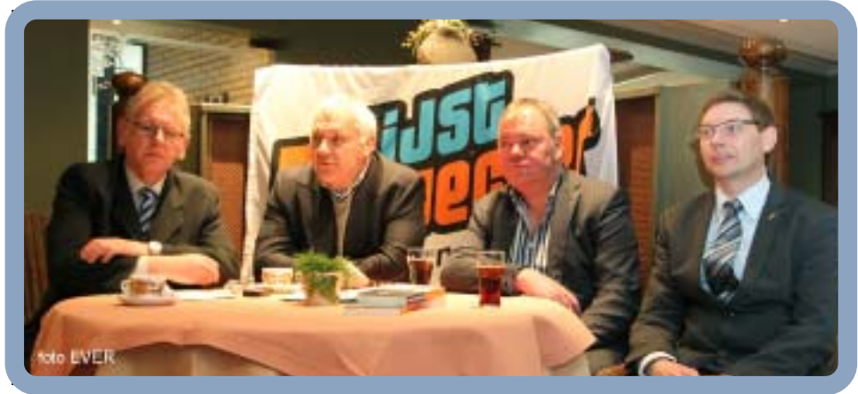
Luisteren en antwoorden op vragen van de pers

logo blijft zoals het is en eigendom van Jean-Marie Dedecker. JM Dedecker wilde niet onder stoelen of banken steken dat LDD een mindere periode doormaakt