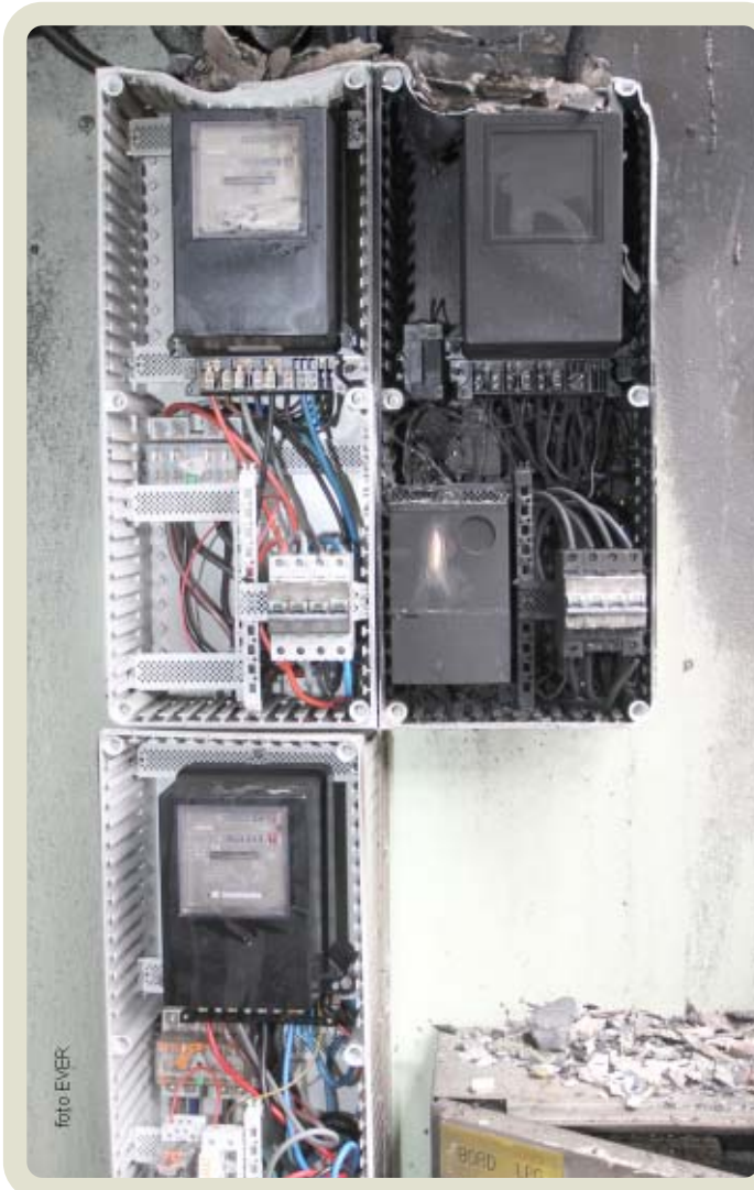
De drie metergroepen van Infrax. Slechts één ervan heeft -aan de scheidingschakelaar- grote schade opgelopen.

De branden, ontstaan door een elektrische oorzaak, zijn niet te tellen. Dat de super gevaarlijke en vaak onwettige aftakleidingen van de Distributie Net Beheerders -DNB- óók vaak de oorzaak zijn, is quasi onbekend. Door de burgerlijke rechtszaak die de weduwe en nabestaanden van Georges Wittevrongel tegen Electrabel op het getouw hebben gezet, kreeg Electrabel na zeventien jaar het deksel op de neus. Voor het eerst werd de niet conformiteit van een elektrische aftakking door een rechter bevestigd.