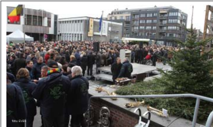
Nieuwjaarsreceptie Lanaken : geef het volk brood en spelen.

Ondertussen was er het Lanakense Carnaval maar nadien werden de maskers niet afgezet want tijdens de daaropvolgende gemeen-