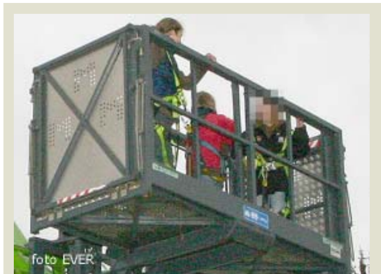
Geen van deze kinderen kreeg passende PBM, toch werden ze 30m hoog gehesen. Zowel de brandweer als de technische dienst van Lanaken waren daarbij ter plaatse en keken toe -sic-.