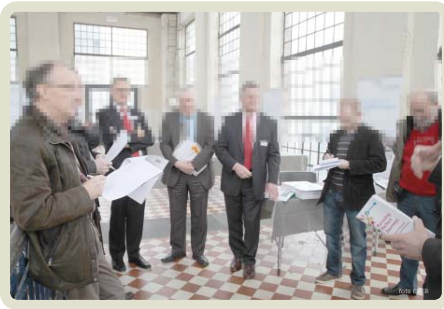
"Staande" in een zaal met slechte akoestiek en storende achtergrond geluiden een persconferentie organiseren, ook dát is Genk

Na veertien jaar ervaring heb ik het nog niet mogen ervaren dat een tiental personen, staande in een cirkel in een immens grote zaal met vervelende achtergrondgeluiden, een Internationale persconferentie houden.