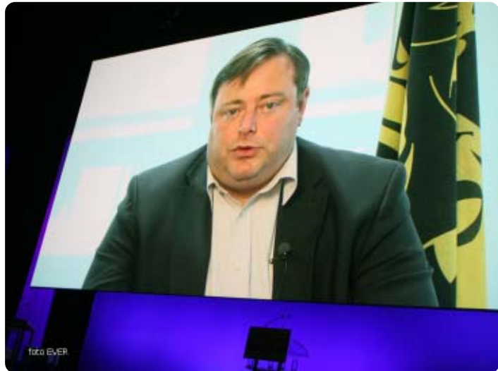
Bart De Wever was bij de start van het “Traject 2012” op 14 oktober in de Brabantthal te Leuven wegens familiale omstandigheden én in zijn “vorig formaat” slechts virtueel aanwezig

In oktober 2011 werd in de Brabantthal te Leuven door de partijtop, samen met 1200 lokale bestuursleden, het startschot gegeven voor het “Traject 2012”. Nagenoeg zes maanden later komt de partij opnieuw naar Leuven om het succes van dat Traject 2012 te recapitulieren en af te sluiten met een nieuwe vormingsdag. De partijtop en meer dan duizend lokale bestuursleden verzamelden in de Aula Pieter De Somer van de KU Leuven aan de Charles De Beriotstraat.