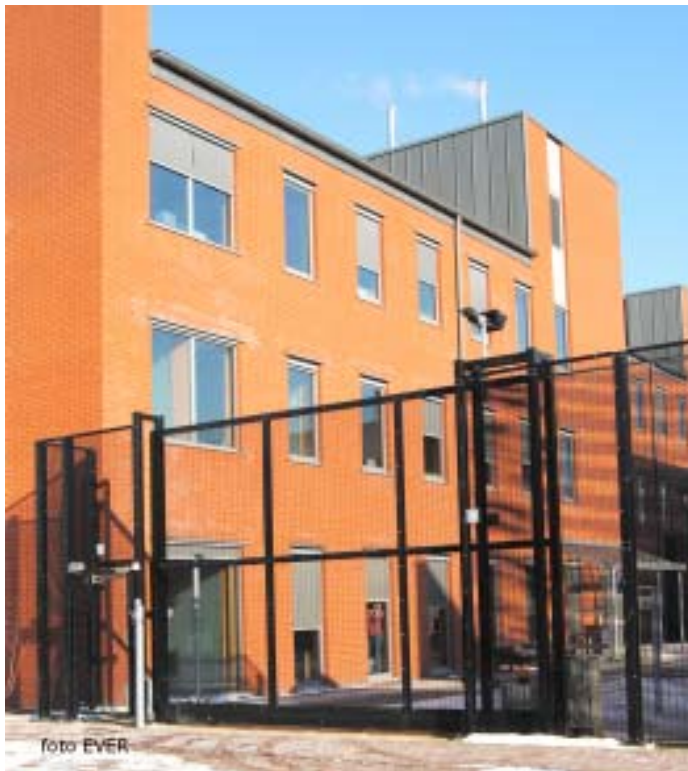
Gemeenschapsinstelling De Kempen, campus De Markt, aan de Molderijk te Mol; in feite een jeugdgevangenis.

De ministers van Welzijn, Pascal Smet, -SP.a- en Onderwijs, Jo Vandeurzen -CD&V- ondertekenden deze morgen in het voormalige en bekende "Wederopvoedingsgesticht", thans te Mol, een overeenkomst. De ministers engageren zich om, samen met de betrokken instellingen en diensten, het onderwijsaanbod in de gemeenschapsinstellingen door nauwere samenwerking te verbeteren. Het wordt wel allemaal omfloerst gezegd maar het gaat hier wel over jongeren die in feite in deze gesloten instelling werden geplaatst en uit de samenleving zijn gerukt, dus ook de school hebben moeten verlaten.