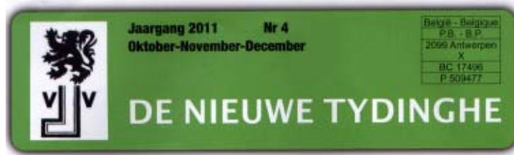
DNT werd plots en zondermeer bij WAG weggehaald

Hebben de leden enige garantie dat ze, zoals de beroepsjournalisten, overal bij persconferenties met hun perskaart welkom zijn? Hebben de leden van de VJV vzw nu