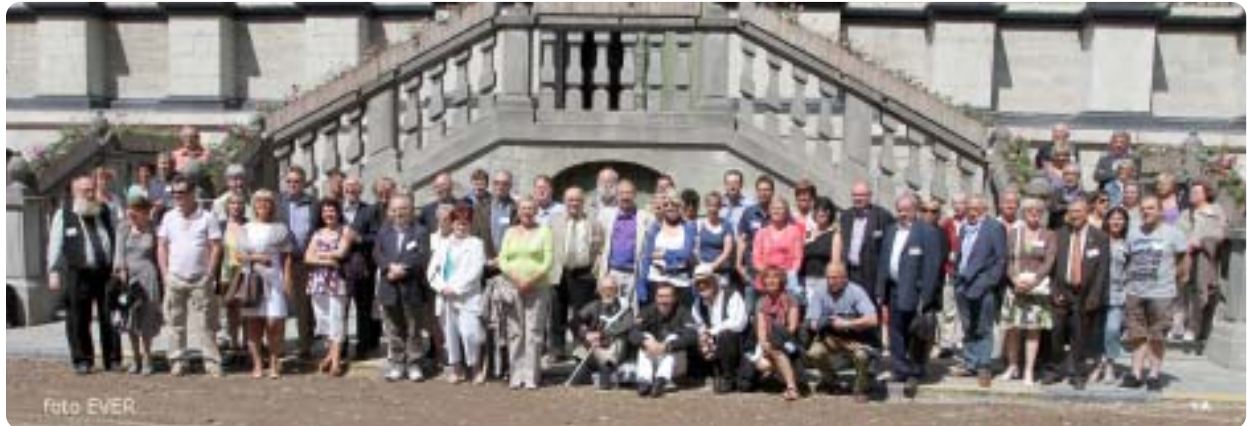
Groepsfoto te Gent - Zonder de "genodigden" die betalen voor het diner zou de groep de helft kleiner zijn.

hebben gegeven waarna ze de opdracht ook gekregen hebben. Bij WAG te Antwerpen spreekt men het verhaal van Offset en