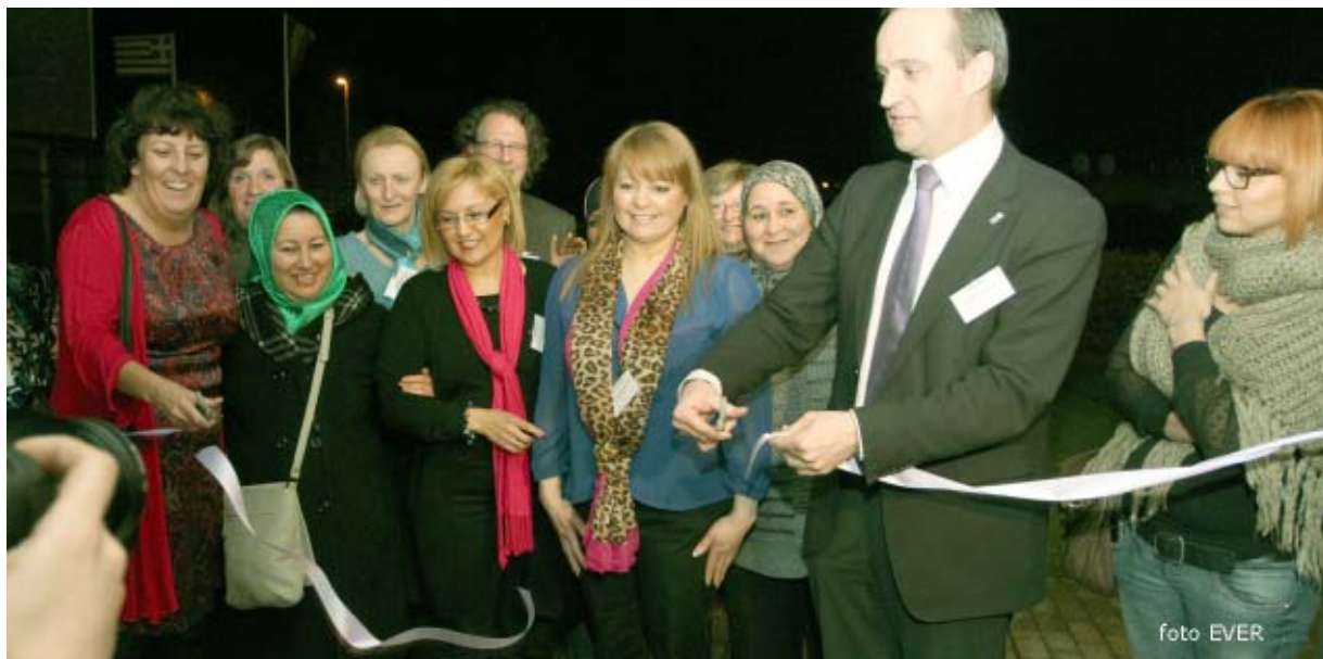
Het officiële lintjes knippen mocht niet ontbreken, de timing om de avond te beginnen werd niet gerespecteerd, deze om het lint door te knippen wel -foto-

maar daar hebben wij echt geen boodschap aan. Zij die het niet breed hebben, ergo arm zijn, krijgen geen kansen en worden zeer gemakkelijk wegens gebrek aan assertiviteit, uitgesloten. Dat minister deze speech in Genk is komen geven, is volgens Morsum Magnificat een schot voor de boeg van het traditionele rollenpatroon noch met een topvrouw in een topfunctie maar het moet zijn uit vrije wil. De ontplooiing van de persoon is van belang en het maakt niet uit of dat gaat om een man of een vrouw. Daarom zijn organisaties als de federatie Wereldvrouwen belangrijk