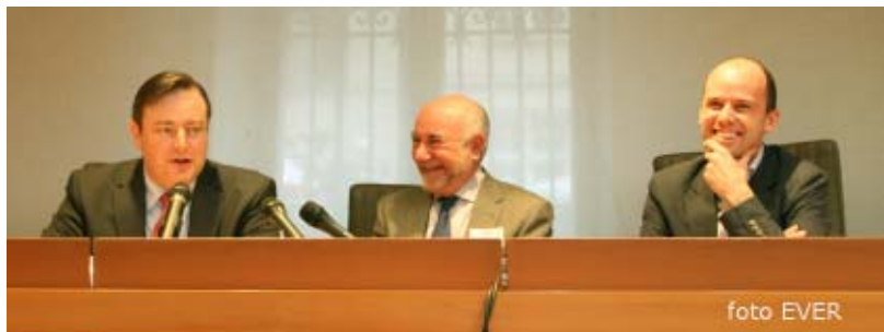
Bart De Wever grapte dat, als hij volgens zijn dokter niet zou gaan diëten, hij met een andere Catalaanse Professor kennis zou maken, wat het aanwezige publiek blijkbaar amuseerde.