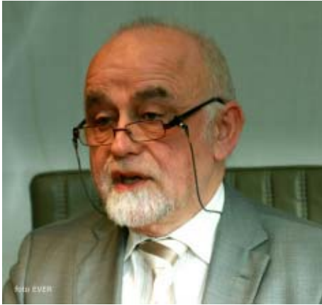
Jan Peumans, Vlaams Parlementsvoorzitter, zoals we hem allemaal kennen.