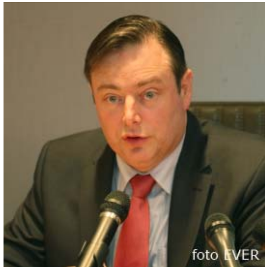
Bart De Wever