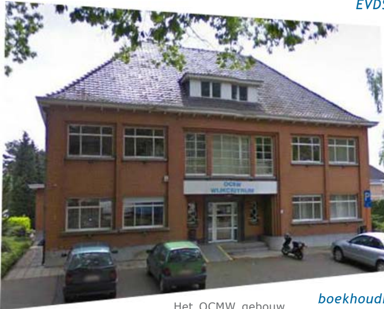
Het OCMW gebouw aan de Onderwijslaan te Waterschei waar EVDS verschillende keren op de rooster werden gelegd.

boekhoudkundige stukken, die in verband staan met Morsum Magnificat, fotokopieën werden gemaakt. EVDS dienden het daaropvolgend -op een bedrag van duizend euro- maandelijks met bijna tweehonderd euro minder te stellen. Een afrekening door het OCMW van Genk?