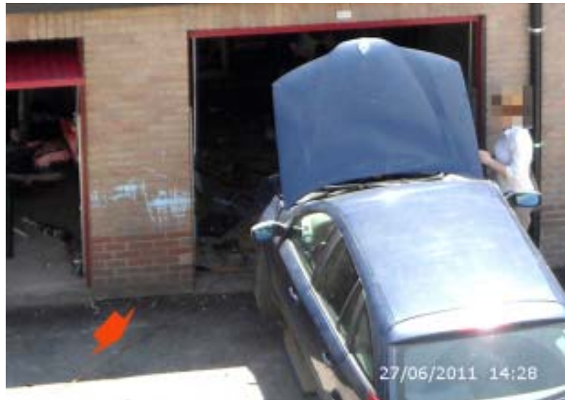
Deze garage, gehuurd van Nieuw Dak, dient enkel en alleen om aan de lopende band auto's te herstellen, dat is tegenstrijdig met de huurovereenkomst. De spanning voor licht en verwarming wordt via een verlengkabel -pijl- uit de kelder afgetakt en iemand van Nieuw Dak staat er bij en kijkt er naar.

schakelaar te overbruggen, dat kan met een enkel-polige schakelaar in parallel met de drukknop-schakelaar te plaatsen. Parallel aan het lichtpunt kan dan een stopcontact gemonteerd worden, maar dat stopcontact is dan op VOB geleiders van 1,5 mm 2 aangesloten wat strikt genomen, indien die leidingen met zekeringen van maximum 16A werden beveiligd, kan. Is dan nog te zien of de beschermingsgeleider is doorverbonden en er een differentieel van 30 mA -vochtige ruimten- de bescherming tegen rechtstreekse aanraking waarborgt.