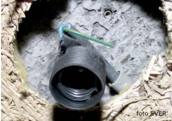
Het lichtpunt in de kelder : de beschermingsgeleider is niet aangesloten! Wanneer iemand daar een metalen armatuur plaatst kan er, gezien het hier om een kelder gaat, dus vocht aanwezig kan zijn, sprake zijn van elektrocutiegevaar. De schakeling is ook niet dubbelpolig.

elektrocuciegevaar, maar daarbij staat uiteraard niemand stil, óók de spionne van Nieuw Dak niet, toch is dit bittere ernst. Als Nieuw Dak geen maatregelen neemt zal iemand, in het kader van het algemeen belang, de kat de bel moeten