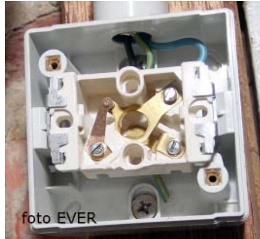
Enkelpolige drukschakelaar zonder controlelampje, beschermingsgeleider niet aangesloten. Bediening door middel van een op de deur geschroefd haaks metalen plaatje is strijdig met art. 5 van het A.R.E.I.

huurder het op één of andere manier klaargespeeld om in zijn privé kelder, spanning af te tappen om in de garage elektrische verlichting of zelfs verwarming te gebruiken. In zo'n geval is dat puur diefstal van elektriciteit van de andere bewoners. De cvba Nieuw Dak heeft, om het lichtpunt -de lamp- in de individuele kelders te doen branden, een drukknop-schakelaar gebruikt en om die drukknop te bedienen hebben de bricoleurs een haaks metalen plaatje op de deur van de kelder geschroefd -zie foto p.1- en pas als de deur volledig geopend is, raakt het plaatje de drukknop en gaat het licht aan. Een verre van professioneel systeem maar blijkbaar goed genoeg voor de sociale wijken in Genk.