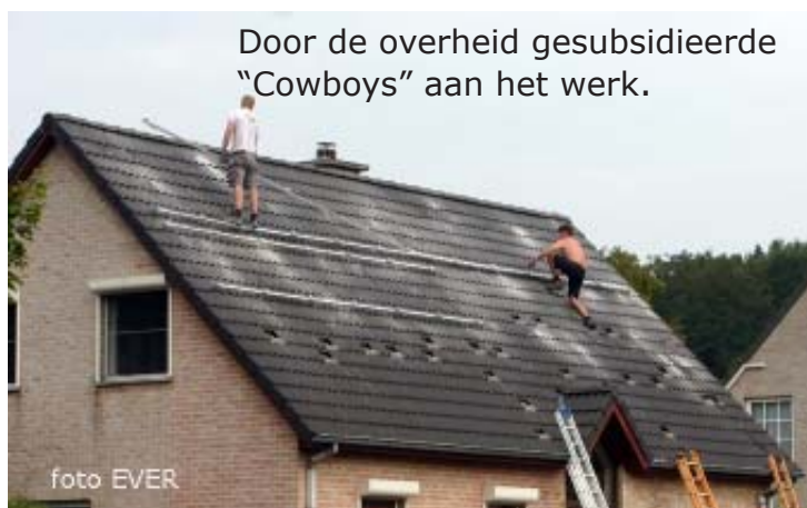
Zonnepanelen plaatsen; een schrijnend voorbeeld van het met de voeten treden van de arbeidsveiligheid. We zijn benieuwd hoe lang de overheid daar nog één euro in gaat investeren.

Het zou eveneens wenselijk zijn dat voor een dusdanige technische materie, de pers wat meer tijd krijgt om een dergelijk lijvig document in te zien. De ontwerpers / bedenkers hebben met een team maanden aan zo'n project gewerkt, journalisten krijgen die tekst in extremis voorgeschoteld en worden verondersteld om het binnen een tijdspanne van een kwartier, of hoogstens een half uur te bevatten en correct weer te geven, iets wat uiteraard onmogelijk is.