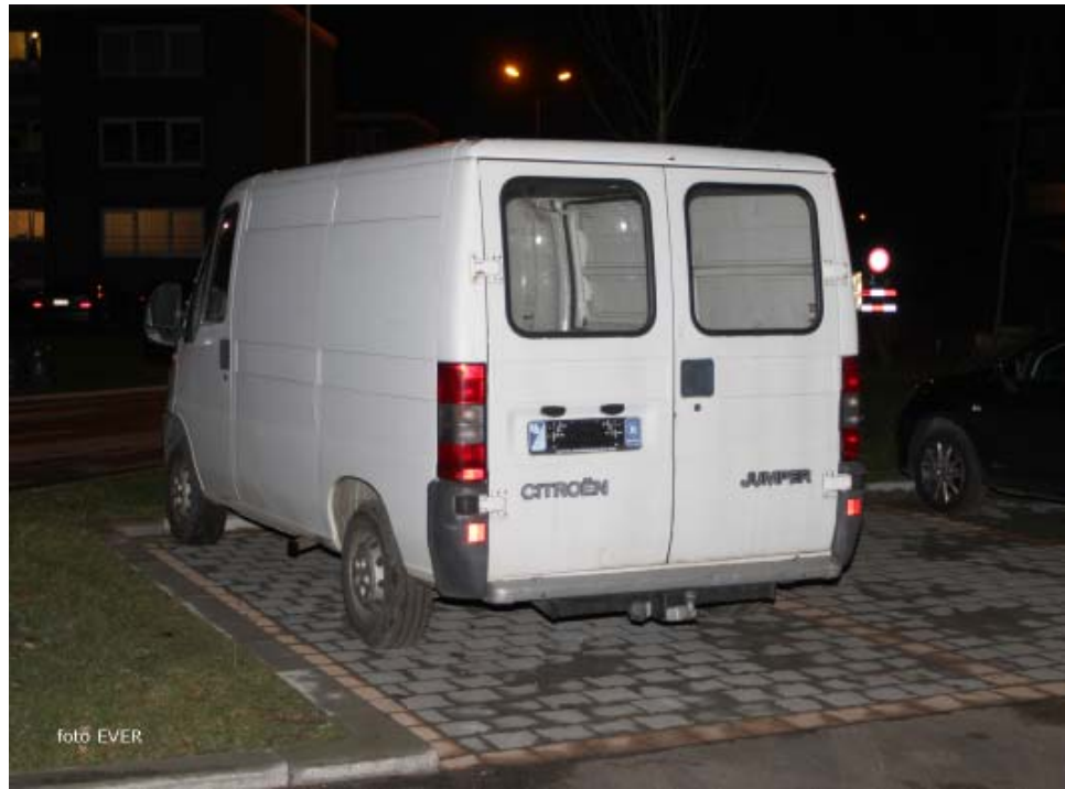
Publieke parkeerplaats Priesterhaagstraat 9. Een witte Citroën zonder DIV nummerplaat die de Politie van Genk niet wil zien.

van p. 1 aanpakken, ondermeer collocatie met de natte vinger. Gisteren dreigde een inspecteur van de Genkse politie iemand die een andere auto heeft gekocht, om diens oude auto te laten takelen. Deze stond, voorzien van een reproductieplaat, op de oprit van zijn privégarage en, alhoewel de nummerplaat bij het DIV was geschrapt, was de wagen gemakkelijk te identificeren vanwege de plaats waar de auto geparkeerd stond. Dat ter hoogte van Priesterhaagstraat 9 een witte Citroën bestelwagen, zonder nummerplaat, op de publieke parking geparkeerd staat, ziet de politie blijkbaar niet.