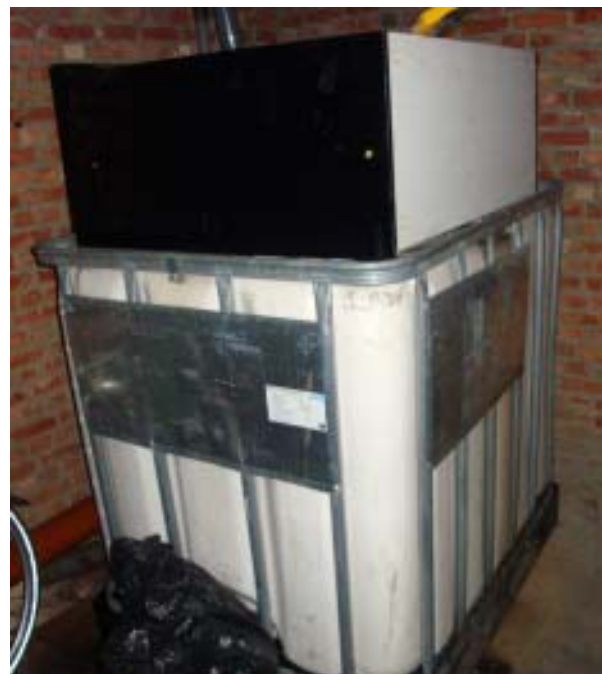
In een kelder in Genk staan er grote en kleine recipiënten die met gestolen brandstof werden gevuld en in kleinere hoeveelheden verkocht.