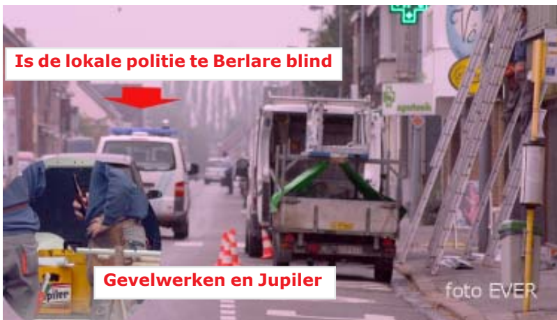
Werken hinderen voetgangers die op de openbare weg dienen te lopen. De arbeiders begonnen om 10u met het nuttigen van Jupiler -foto inzet -. De lokale politie van Berlare -Gehucht van De Gucht- is er diverse keren gepasseerd maar ondernam niets.

en in burger, pakte de hoofdredacteur van Morsum Magnificat -die met een deels geopend raam in de auto achter het stuur zat- zonder enige reden of aanleiding bij de kraag, een voorval dat onmiddellijk aan het Comité P. werd gemeld. De wijkagent zou ook maar al te gemakkelijk een inschrijving op hoofdverblijfplaats toestaan waar dat niet kon. Na enkele dreigementen werd de zaak aan de FGP van Hasselt gemeld die verder onderzoek voerde. Morsum Magnificat bewees ook dat er drugs werden verhandeld op de parking van De Kring in Waterschei en cocaïne in een appartement in Kolderbos. Toch is het Morsum Magnificat die