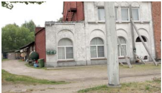
De gevel van dit gebouw wordt door schuine versterkings stabiël gehouden, of dat volstaat is maar zeer de vraag. Aan de zijkant worden de vroegere duiventillen door Oost-Europeanen bewoond, maar hier sluit Genk de ogen.