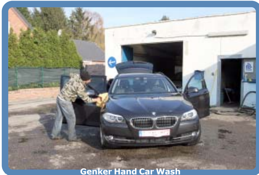
Genker Hand Car Wash