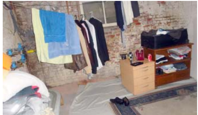
Een voorbeeld van de woon- en leefsituatie van een Oost- Europeaan in Waterschei, toegestaan door een wijkagent die niet vies is van hand- en spandiensten.