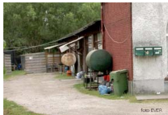
Drie brievenbussen voor de koterijen waarin blijkbaar evenveel Oost-Europeanen mogen hokken.