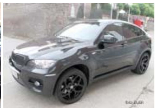
Auto van Janssens Gemis, Duitse zware wagens die ze voor hun duidelijk winstgevende activiteiten, in casu gesteund door Belgacom, gebruiken.

gerechtsdeurwaarder te Turnhout, verdeelt de betalingen op de voor haar kantoor meest gunstige wijze : "Kosten maken", dus kassa, kassa en dit in casu op de kap