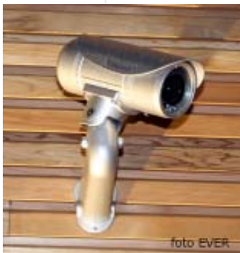
Camera, op de toegangsdeur gericht, is niet met een pictogram aangegeven.