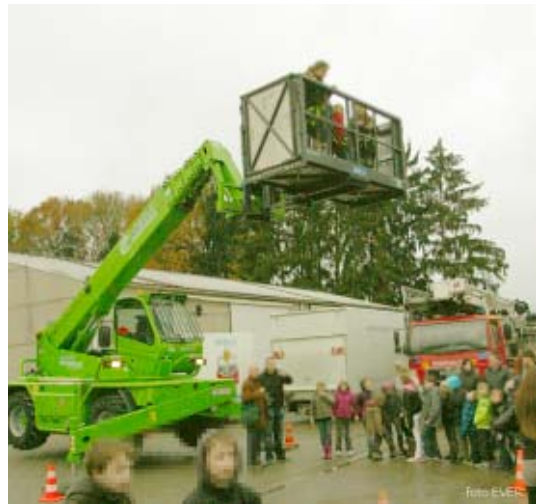
In geen geval laat men toeschouwers onder een gondel, vallijn of draaicirkel van een kraan of hoogwerker toe, de zone moet wel degelijk worden afgebakend. De preventieadviseur van Lanaken is een wassen neus.

verstopt, kunnen wij evenmin nagaan of de beschermingstoestellen wel juist gekozen werden in functie van de afstand van de hoogspannings-cabine, uiteraard minstens 6kA, maar dat kan soms onvoldoende zijn. Het feit dat Elektrotest de elektrische installatie uiteindelijk volledig goedgekeurde en er "geen" opmerkingen gemaakt werden, zegt niet dat de installatie écht conform is. Morsum Magnificat heeft in