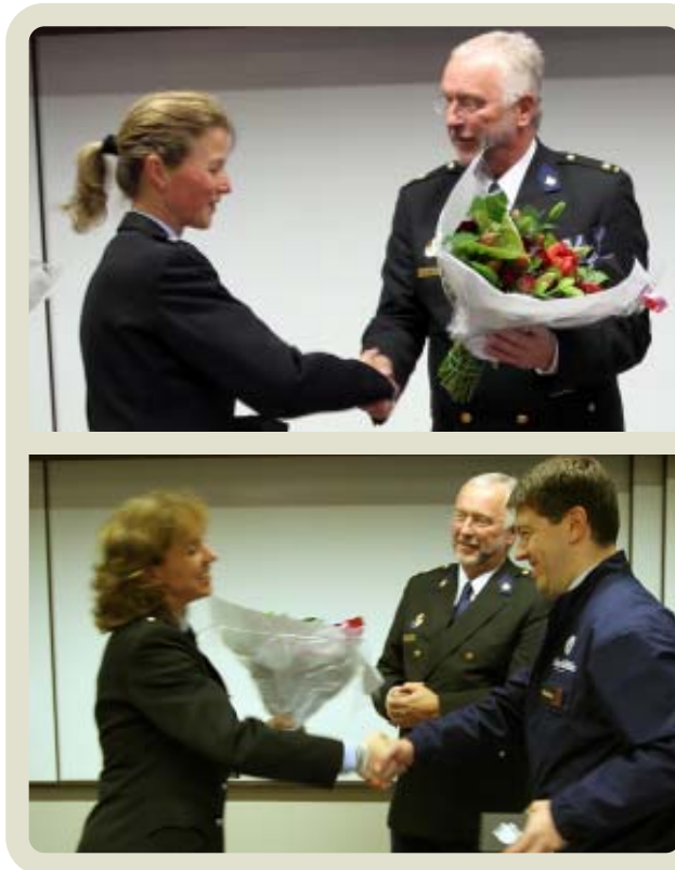
Vrouwelijke medewerksters van de Koninklijke Marechaussee die een belangrijk aandeel in de cursus hadden, werden met een "souvenir" bedacht en in de bloemen gezet.