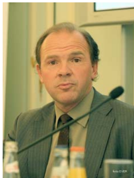
Minister van werk Philippe Muyters

Wilt u alles weten over Flanders' Care ga dan naar de link onderaan deze pagina.