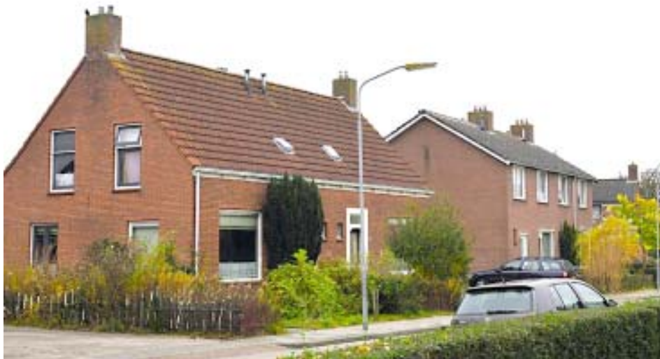
Hier wonen ze in Warffum