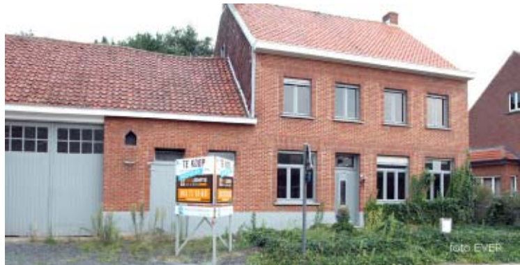
Rhode, Testelt : Hier hebben ze eigenaar Herman VL de stuipen op het lijf gejaagd, het is ook daar dat de paarden spoorloos verdwenen.

om nog één euro te kunnen recupereren, maar het moet blijken dat hij een verzekering heeft voor dat soort zaken, maar natuurlijk gaat het alleen over bepaalde risico's, "de herstellingen die we hebben moeten laten uitvoeren vallen daar buiten" zegt hij. Het is wel frappant dat zelfs voor het grapje met de