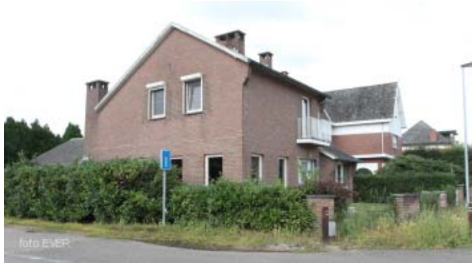
Wolfsdonk : Vier maanden nodig om het huis opnieuw op te knappen en opnieuw bewoonbaar te maken.