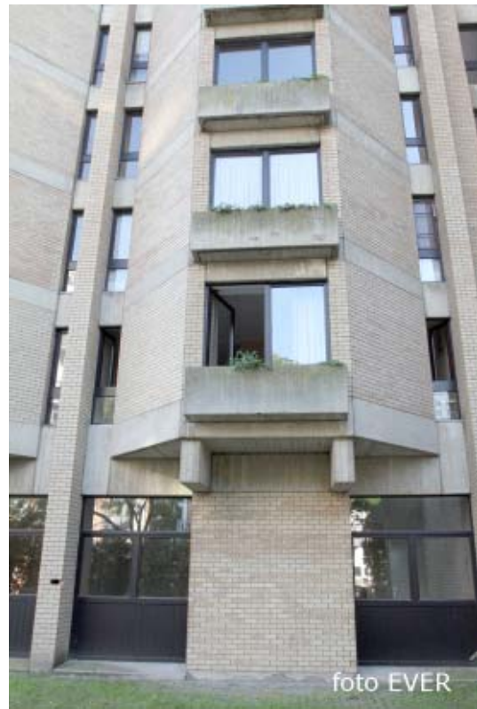
Blok 4 van Sint Maartensdal, waar onlangs nog een vrouw werd vermoord, is de woonplaats van Marthe Falize. Dijledal heeft na de onbewoonbaarverklaring van residentie Grunwald enkele appartementen voor vier maanden aan het OCMW verhuurd.

Het moet blijken dat het OCMW-Leuven via derden, die daarvoor niet gevolmachtigd zijn, bemiddeling zoekt en toch bij wijze van uitzondering een noodwoning ter beschikking kan stellen. Marthe moet echter eerst garanties eisen en pas daarna de sleutel overhandigen.