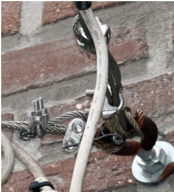
Attractie I : Stationsstraat.

Morsum Magnificat wil met haar niet aflatende kritiek op de handel en wandel van gemeenten, steden en de Vlaamse -p-Overheid aantonen dat het "systeem" de burgers van dit land overal te pas, en vooral te onpas, naar een onontwarbaar kluwen van wetten leidt. Burgers die overal in het gareeltje moeten lopen en al voor twee kilometer te snel te rijden, beboet worden terwijl diezelfde overheid zelf overal in de fout gaat. Burgers hebben wettelijk het recht om mistoestanden aan te kaarten en dat is wat deze redactie, die haar technische kennis al voldoende aangetoond, doet. Indien men daar in het kader van het algemeen belang geen gebruik van wenst te maken, zal die kennis tégen hun worden gebruikt.