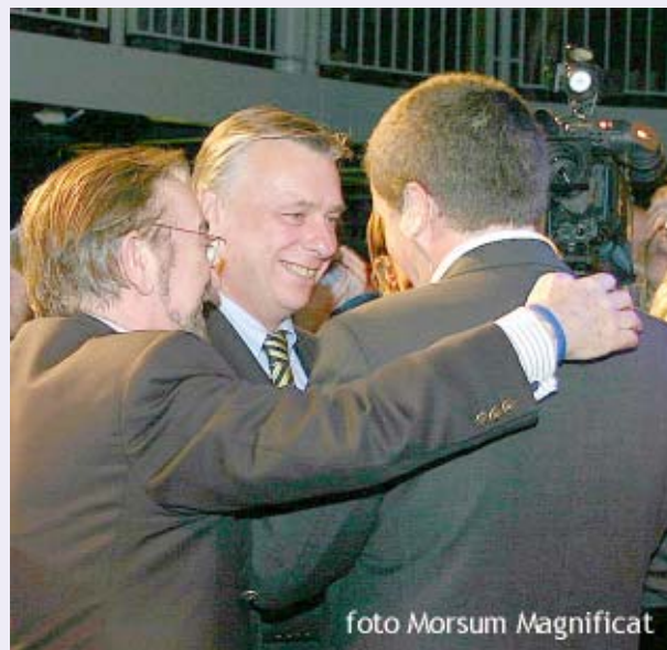
Twee belangrijke diensten onder zijn bevoegdheid werken niet naar behoren, waaronder de Nucleaire Veiligheid

Tijdens de recente VLD nieuwjaarsreceptie zei Minister Dewael tegen de redacteur van Morsum Magnificat : " ge bent hier om foto's te maken, maar niet om vragen te stellen " .