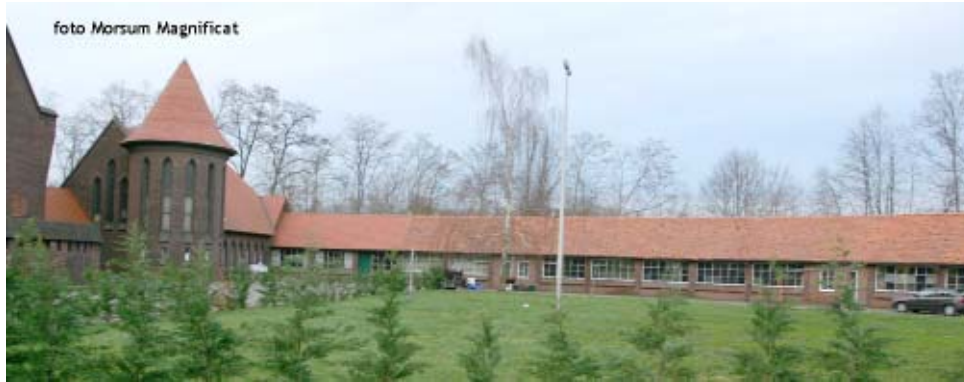
Alle gebouwen rond de kerk dienen als één geheel met de toren te worden beschouwd en dus eveneens met een bliksemafleider tegen directe blikseminslag te worden uitgerust.

Ministers" weet Dewael dat maar al te goed.