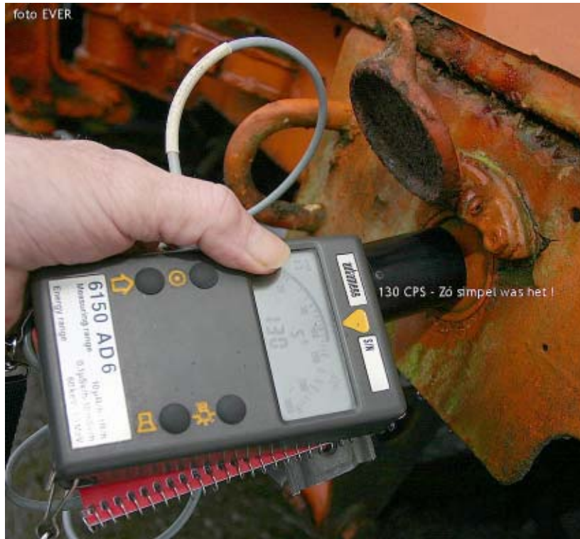
Civiele Bescherming, twee meettoestellen en twee AGS'ers waren niet in staat om dit metertje te ontdekken, Morsum Magnificat deed het in 10 minuten ! Waarom konden zij men met hun AD-2 niet meten ?

(contanimatie) meter van Thermo meegebracht, maar het verhoopte resultaat kwam er niettegenstaande toch niet, óók niet door de aanwezigheid van maar liefst twee AGS'ers !