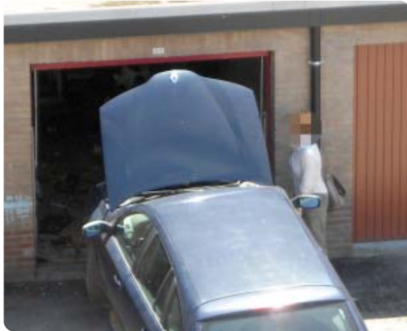
Garage Kolderbos : Nieuw Dak staat er bij en kijkt er naar ....

Het is vandaag zo ver gekomen dat ouders van balorige of ergo, criminele jongeren, niet door de politie aan de tand gevoeld kunnen worden, vanwege "onvoldoende kennis van