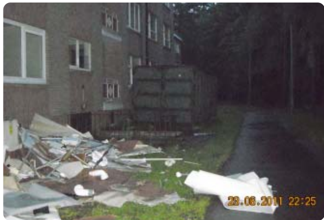
Dit zijn de methodes van het Limburgs Sloop Bedrijf dat in de Priesterhaagstraat in opdracht van de cvba Nieuw Dak via aannemer Renotec opdrachten uitvoert.

Kolderbos is er door BELAC nog een onderzoek lopende. Het moet ook blijken dat de verlichting van de ganse kelderruimte aangesloten is op de metergroep van de algemene delen. Om het licht in de individuele kelders te laten branden, volstaat het om de individuele kelderdeur te openen. Een doodsimpele