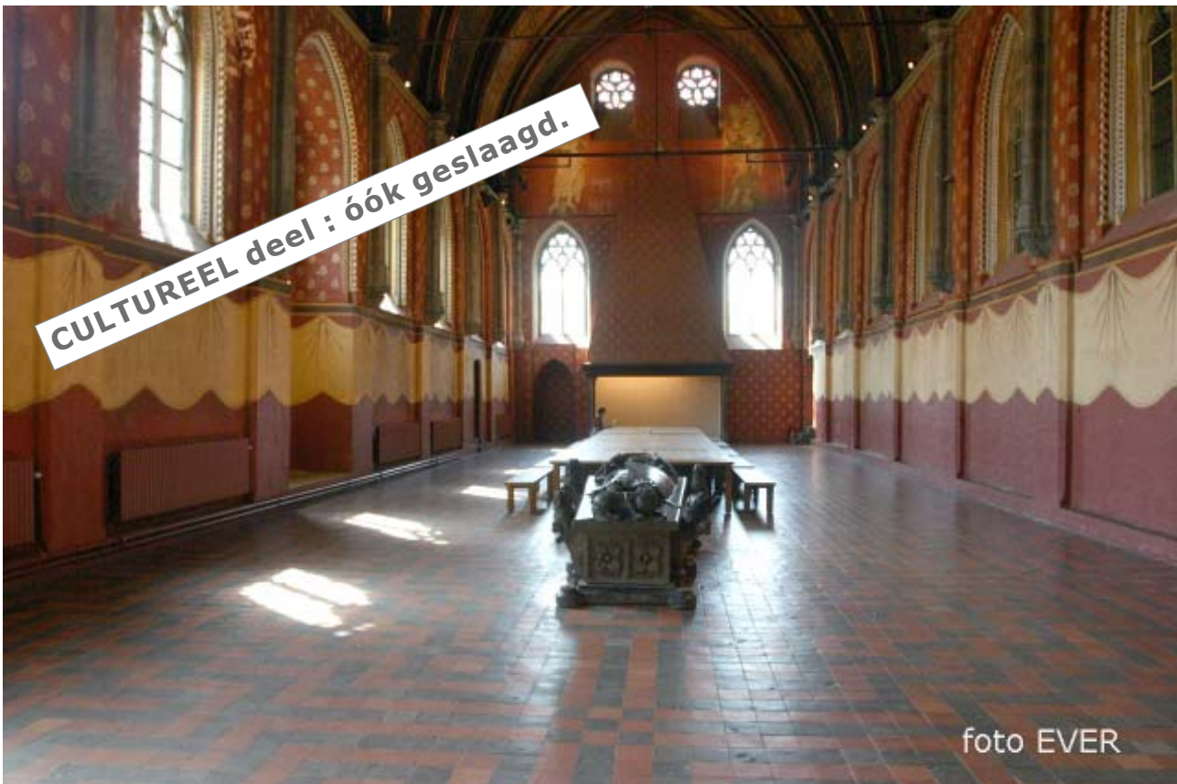
ABDIJREFTER - Deze zaal fungeerde eeuwenlang als refter van de zusters. Op de voorgrond het grafmonument van Hugo II -overleden in 1232- en Burggraaf van Gent van 1227 tot 1232.