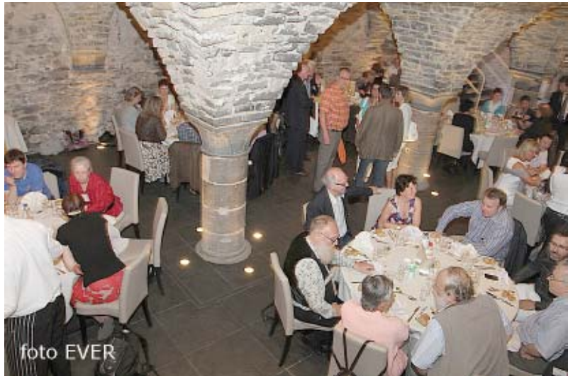
Novotel : Kelder uit de 17e eeuw.

voor de VVJ en dat allemaal om toch maar erkend te worden en zich aan de deontologische code van RVJ te laten onderwerpen om zodoende misschien een symbolische subsidie te ontvangen. Waarom moet de Vlaamse Journalisten Vereniging vzw persé haar onafhankelijkheid op het spel zetten voor een symbolische subsidie? Heeft de VJV vzw met haar krenterige schatkist-bewaarder niet bewezen, geen subsidie nodig te hebben. Waarom kan de VJV vzw dan niet financieel, de facto journalistiek, onafhankelijk blijven?