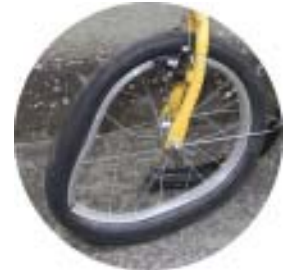
Het voorwiel van de fiets.

Niettegenstaande wij het relaas van de bestuurster van de Volvo -nog- niet hebben kunnen vragen, staat het als een paal boven water dat de VW Golf, die op de verhoogde berm op een niet als parkeerstrook voorziene plaats staat en bovendien geen nummerplaten draagt, het zicht van de bestuurster van de bestuurster van de Volvo moet ontnomen hebben, zelfs het fietsertje, dat slechts vijf jaar is, door die hindernis mogelijk niet gezien heeft.