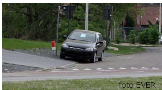
Driehoekstraat Genk : geen nummerplaten.