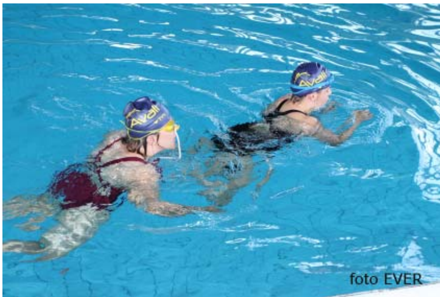
Er werd vandaag in het Genks zwembad al druk geoefend

Een Nederlandse begeleidster vertelde ons dat de deelnemende